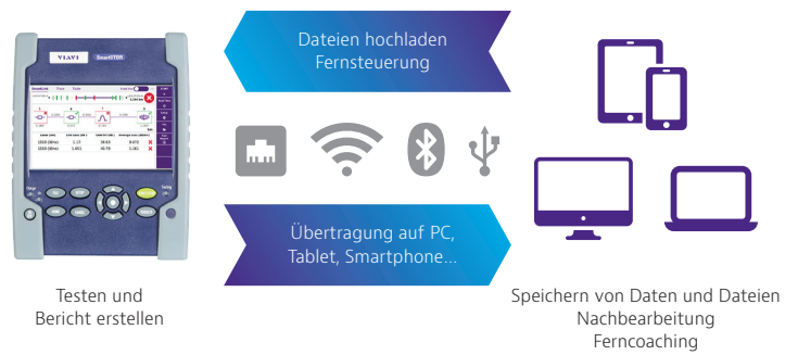
Leistungsstarke Verbindungen und Optionen vereinfachen die Arbeit

Zum Lieferumfang des SmartOTDR gehört ein einjähriger Testzeitraum für die cloudbasierte Lösung StrataSync™ zum Verwalten der Ressourcen, Konfigurationen und Testdaten, die gewährleistet, dass alle Messgeräte mit der neuesten Software und den aktuellen Optionen ausgestattet sind.